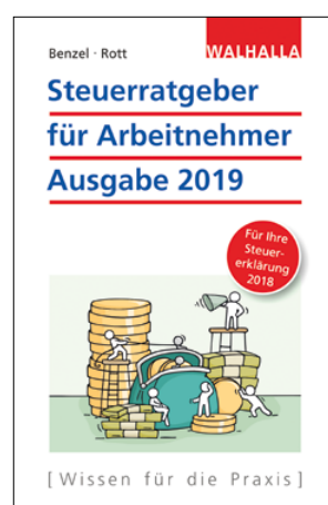
Wolfgang Benzel, Dirk Rott Steuerratgeber für Arbeitnehmer 2019 Ausgabe 2019 – für Ihre Steuererklärung 2018

ca. 240 Seiten, kartoniert Neuerscheinung 978-3-8029-3224-3 ca. 9,95 EUR November 2018