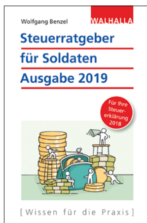
ca. 232 Seiten, kartoniert Neuerscheinung 978-3-8029-6286-8 ca. 9,95 EUR November 2018