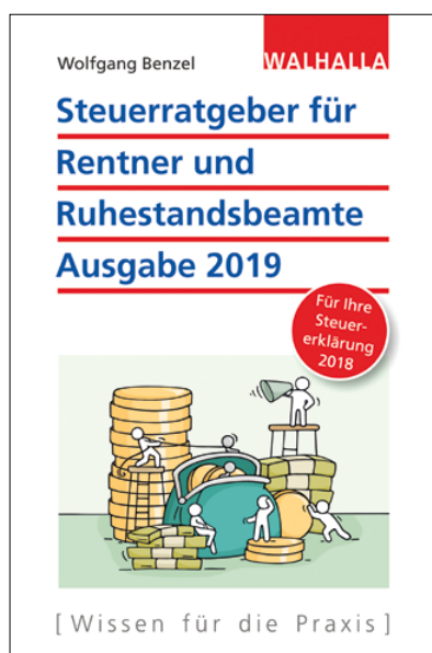
Wolfgang Benzel Steuerratgeber für Rentner und Ruhestandsbeamte 2019 Ausgabe 2019 – für Ihre Steuererklärung 2018

Unschlagbar günstig und kompakt. Der Steuerratgeber für Rentner und Ruhestandsbeamte geht auf die häufig gestellte Frage der Steuerpflicht ein. Schrittweise leitet Sie dieser Leitfaden durch die Berechnung Ihres zu versteuernden Einkommens und gibt Hilfestellung bei Ihrer Steuererklärung.