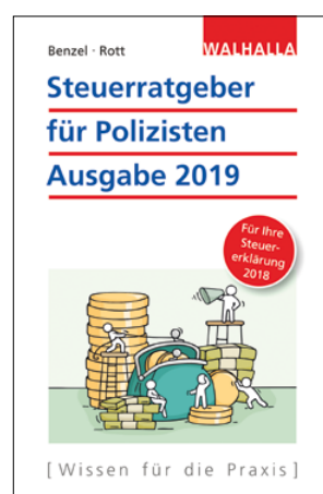
Wolfgang Benzel, Dirk Rott Steuerratgeber für Polizisten 2019 Ausgabe 2019 – für Ihre Steuererklärung 2018

ca. 232 Seiten, kartoniert Neuerscheinung 978-3-8029-3215-1 ca. 9,95 EUR November 2018